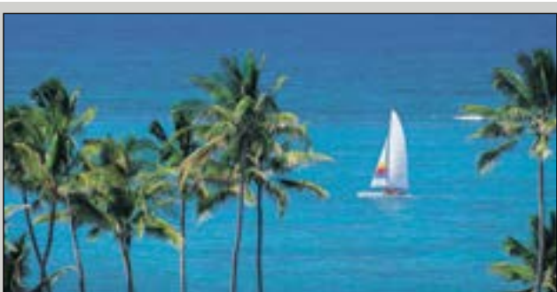
El condado de Palm Beach tiene una pintoresca línea costera de 47 millas.

Esta guía puede ser de utilidad para que realice sus trámites con más rapidez de manera que tenga más tiempo para disfrutar de todo lo que el condado de Palm Beach ofrece.