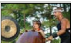
En el museo Morikami y Jardín Japonés en Delray Beach, se llevan a cabo festivales y eventos especiales.

Para obtener una lista de actividades y sitios de interés, visite pbcgov.com y haga clic en Things to Do (Actividades) o el sitio web Discover the Palm Beaches Florida (Descubra las Palm Beaches de Florida) en thepalmbeaches.com . Para obtener información sobre eventos culturales y artísticos, visite el sitio web del Consejo de Cultura en palmbeachculture.com .