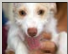
El principal refugio de animales del condado de Palm Beach se encuentra ubicado en el 7100 Belvedere Road, West Palm Beach.

Los perros y los gatos de cuatro meses o más deben tener una placa con la licencia de la vacuna contra la rabia que se adquiere anualmente en Atención y Control de Animales (ACC, por sus siglas en inglés), veterinarias locales o en petdata.com . Las placas de identificación también se pueden renovar en ACC o en petdata.com . Llame al 800-738-3463 para obtener información o visite pbcgov.com/animal . Los residentes que reciben asistencia pública pueden obtener vacunas contra la rabia y placas para mascotas esterilizadas sin cargo.