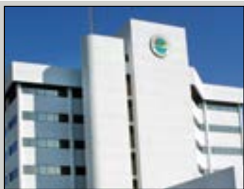
La oficina administrativa central se encuentra en el 301 N. Olive Ave., West Palm Beach.

El público puede entregar comentarios a la junta durante “Temas enviados por el público” que, generalmente, se realiza en la tarde. En ese momento, los residentes pueden dirigirse a la junta sobre diferentes temas de su jurisdicción. Todos los que deseen hablar deben completar una Tarjeta para comentarios del público. Visite pbcgov.com o llame al 355-3229 para obtener más información.