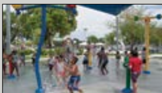
Westgate Splashpark es una de las áreas de juegos interactivos del condado, en West Palm Beach.

Para obtener una lista completa y un mapa de los parques del condado, llame a Parques y Recreación al 966-6600 o visite pbcgov.com/parks . El condado de Palm Beach administra una gran variedad de propiedades recreativas, como piscinas, playas, parques acuáticos, parques de chapoteo, centros recreativos, canchas de tenis y de pickleball, zonas de juego libres de obstáculos, anfiteatros, parques para perros y zonas para acampar. El Departamento de Parques y Recreación, también, ofrece campamento de verano.