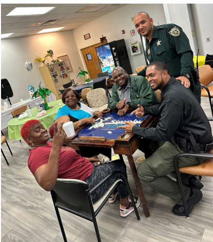
Dominó con PBSO WDC

Cuándo: Lunes y Miércoles, 10:00 a.m. - 11:00 a.m.