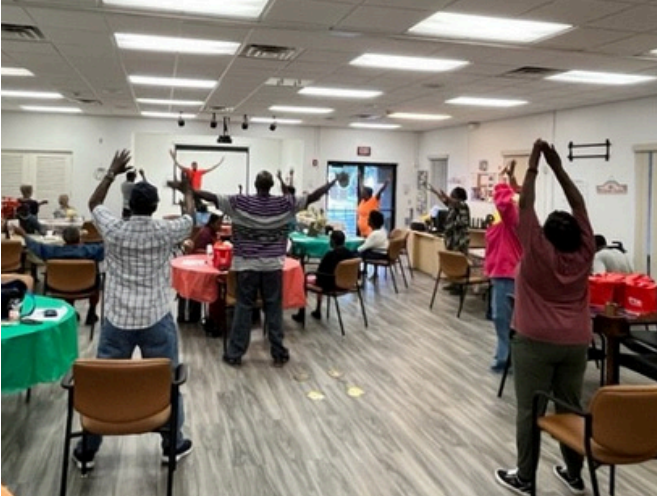
Clase de fitness para personas mayores

2916 State Road #15 Belle Glade, FL 33430 (561) 996-4808