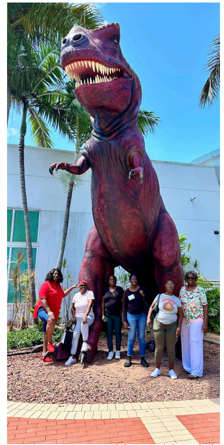
Personas mayores del oeste del condado visitan el zoológico de Palm Beach