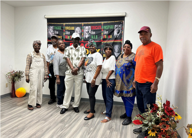
Celebración del Mes de la Historia Afroamericana