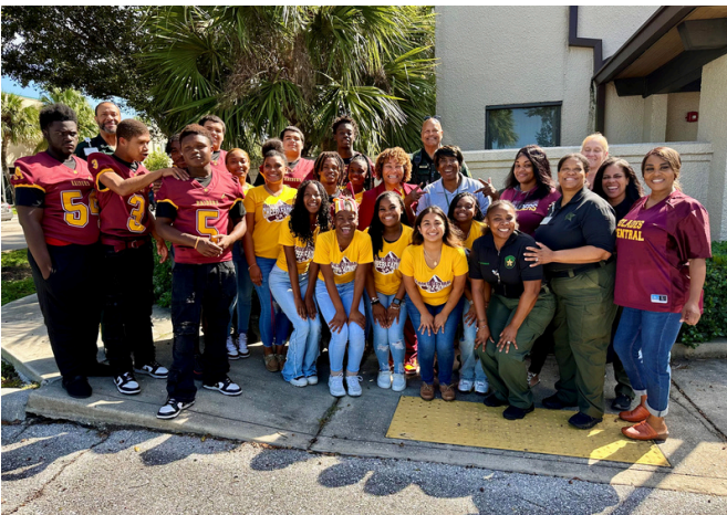
Muck Bowl y PBSO WDC y escuela secundaria Glades Central